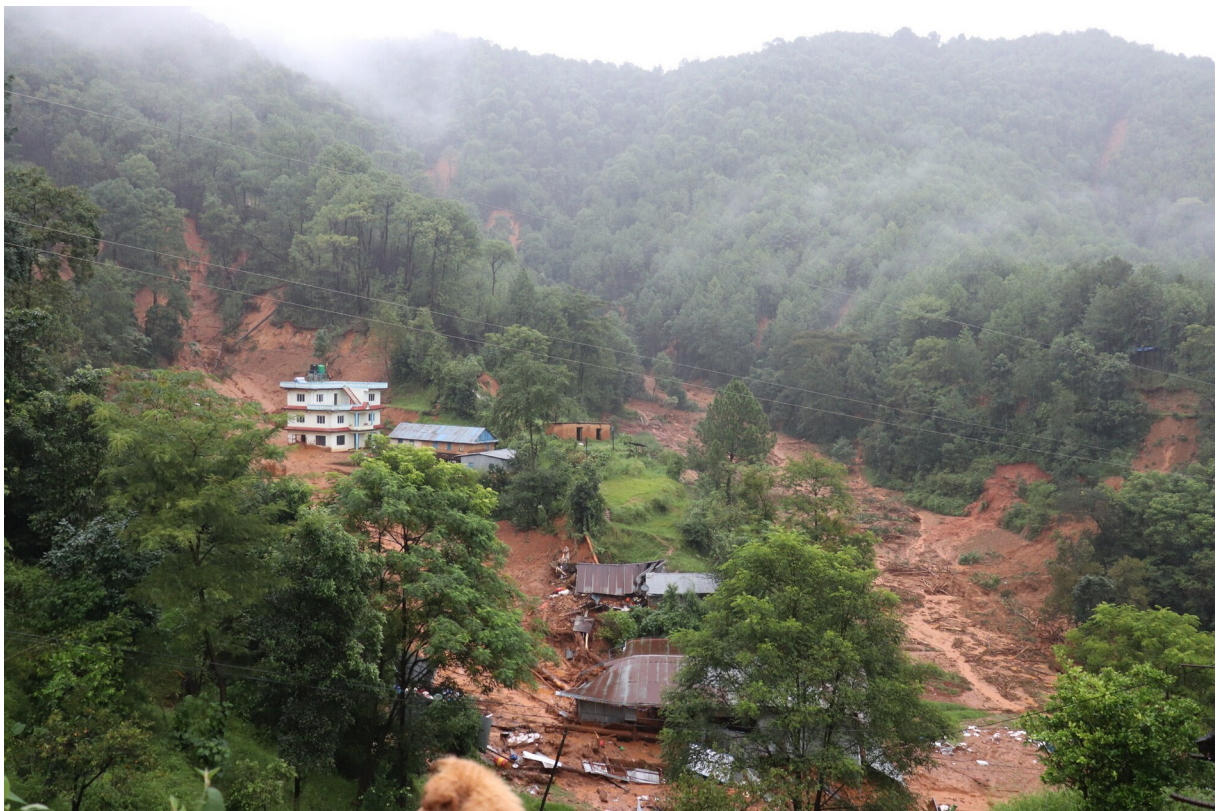
Anandabanin sairaalan aluetta syksyn 2024 maanvyöryjen jälkeen

LAUANTAI / SUNNUNTAI Pyydämme rukoilemaan Anandabanin sairaalan johdon puolesta. Ohjatkoon Jumala tiimiä, niin että he palvelisivat nöyrin sydämin tarvitsevia.